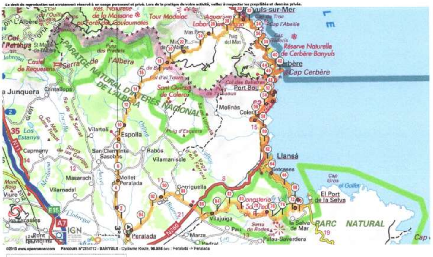
Perfil i mapa de la sortida amb les pujades al Coll de Banyuls i Sant Pere de Rodes